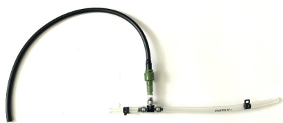
Spezielles Kit Rotax (A)

3) Montage des speziellen Schlauchkits (A) oder des Standard Kits (B)