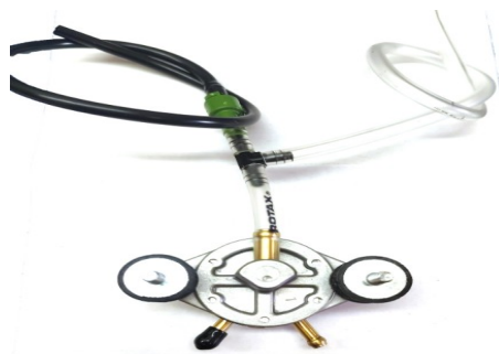
Standard Kit (B)